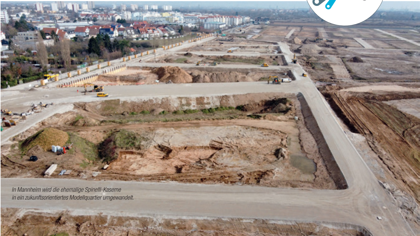
In Mannheim wird die ehemalige Spinelli-Kaserne in ein zukunftsorientiertes Modellquartier umgewandelt.